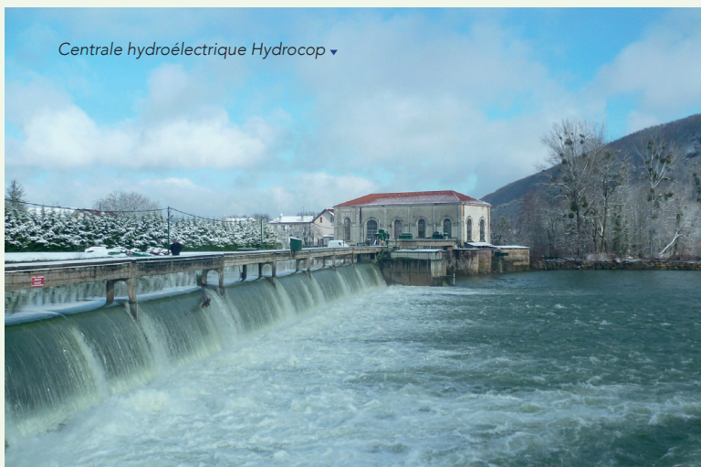
Centrale hydroélectrique Hydrocop ▾

La production annuelle est d'environ 22 GWh soit la consommation électrique d'environ 10 000 habitants .